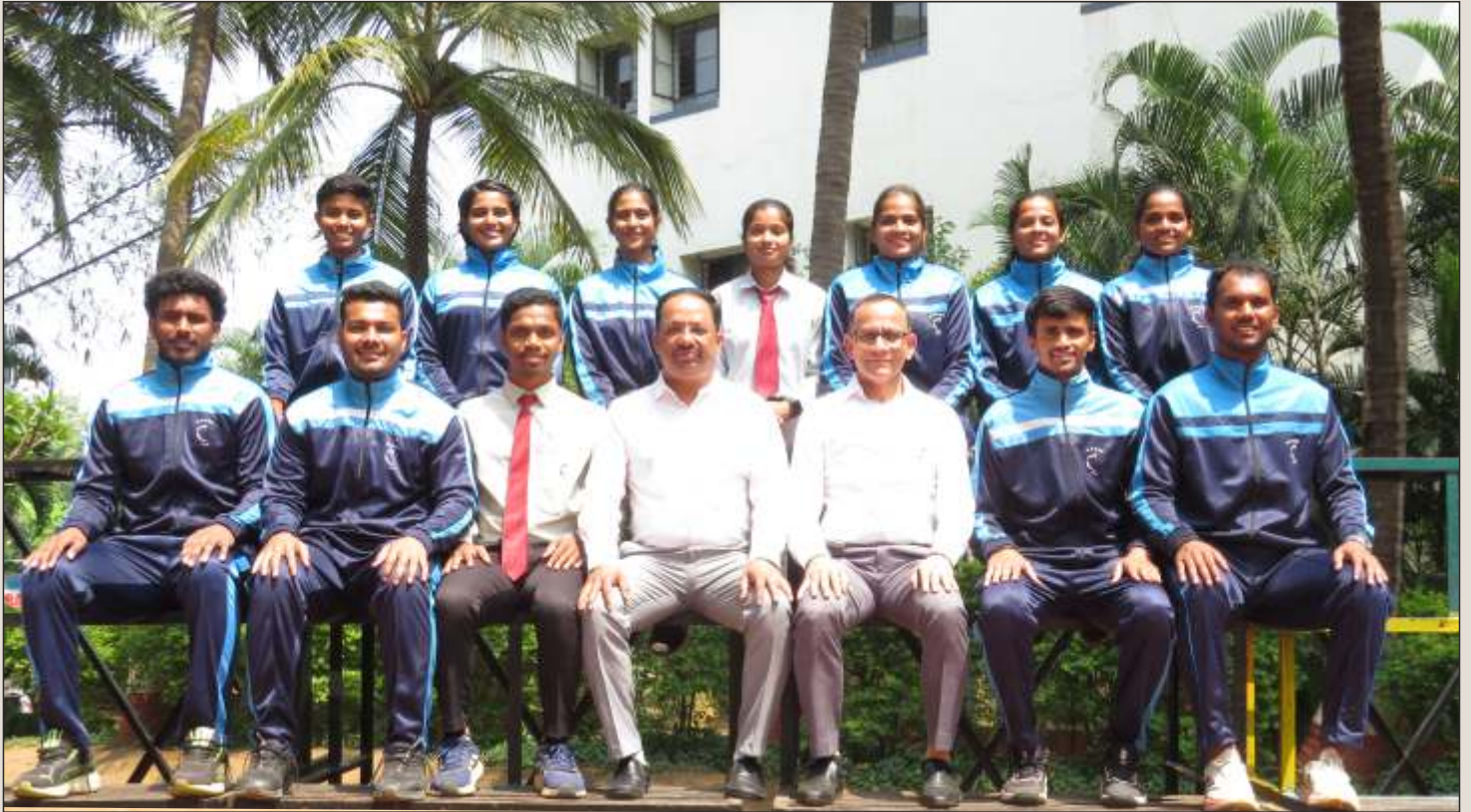
All India and Inter University Players