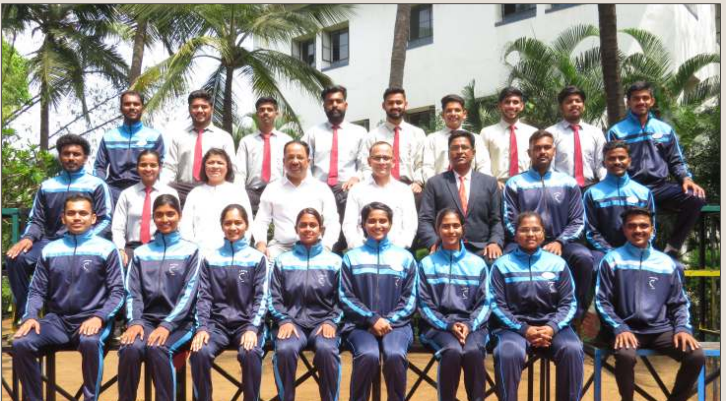
Student Council of the Year