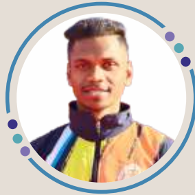
Rohit Bhayaje Kho-Kho